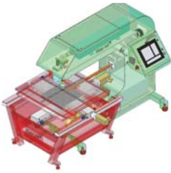
1x1 Medidas Measures: 350x260x181 cm (con vallas de seguridad with security fences)